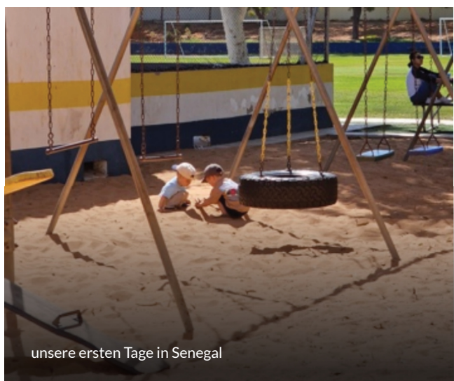
unsere ersten Tage in Senegal