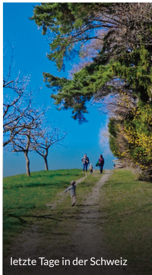
letzte Tage in der Schweiz

«Erst wenn wir leere Hände haben, sind wir bereit neue Dinge zu empfangen.» Silas Rupp