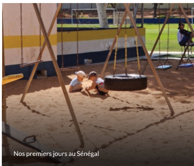
Nos premiers jours au Sénégal