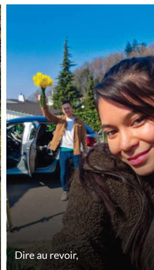
Dire au revoir,