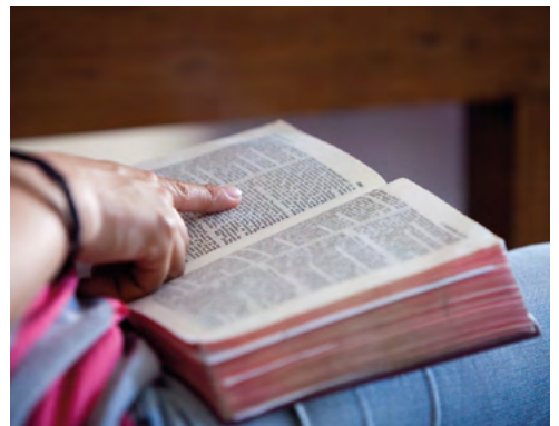
Sports Friends Pérou